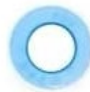
ФУМ лента (в комплекте)